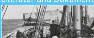
Truppentransport auf Woermann-Dampfer (1904).

Literatur und Dokumente zum deutschen Kolonialismus